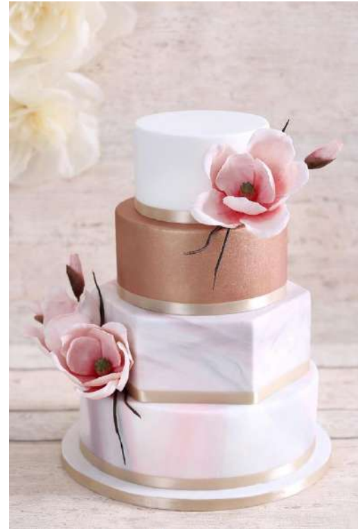
Pasta de zahar